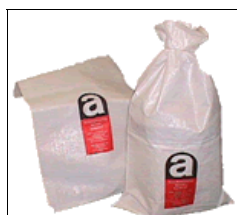
Polypropylen szövet zsákok