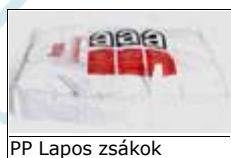
PP Lapos zsákok