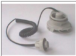
Phantom légfúvó motor