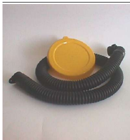
Powerpack tömlő és Deko-Deckel